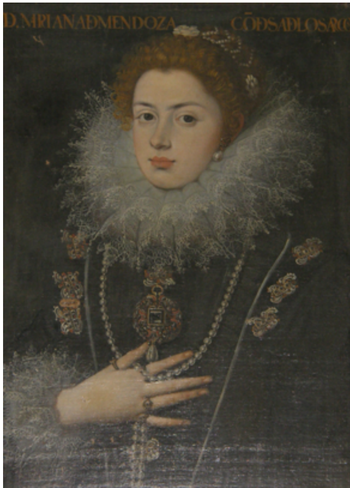
Rodrigo de Villandro, D. a Mariana de Mendoza, condesa de Los Arcos . Capilla de Reliquias, iglesia de Santiago Apóstol, Cuerva (Toledo).

guarnecen rosas y lirios que no marchita la edad, esta prenda amada, muerta, mi bien, mi vida, será. Mientras como parte suya me vuelvo alegre a juntar, durmiendo en tálamo bello te miro. De aquí en jamás, se apartará mi memoria, mi fe ni mi voluntad. Aquí, querido ángel mío, si penas me dan lugar, mientras tú, gloriosa, ríes, yo te lloraré de hoy más.