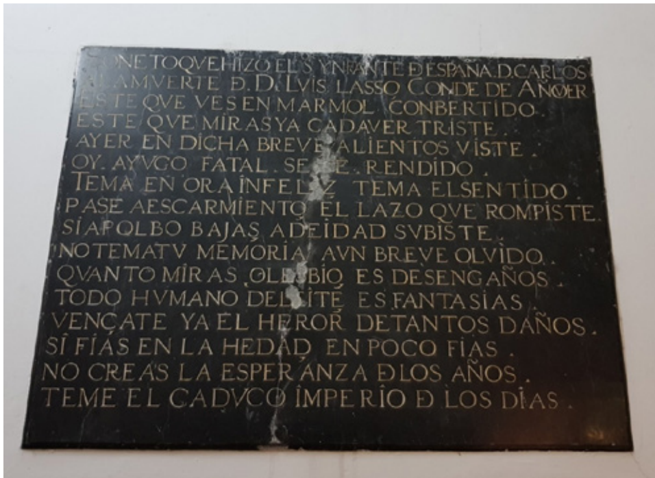
Poema del infante D. Carlos a D. Luis Laso de la Vega, conde de Añover, en el Transparente de la iglesia de Santiago Apóstol, Cuerva (Toledo).