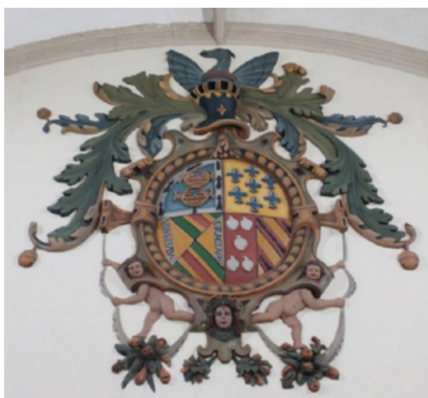
Escudo del I Conde de Los Arcos.

Coro de la iglesia parroquial de Santiago Apóstol en Cuerva (Toledo)