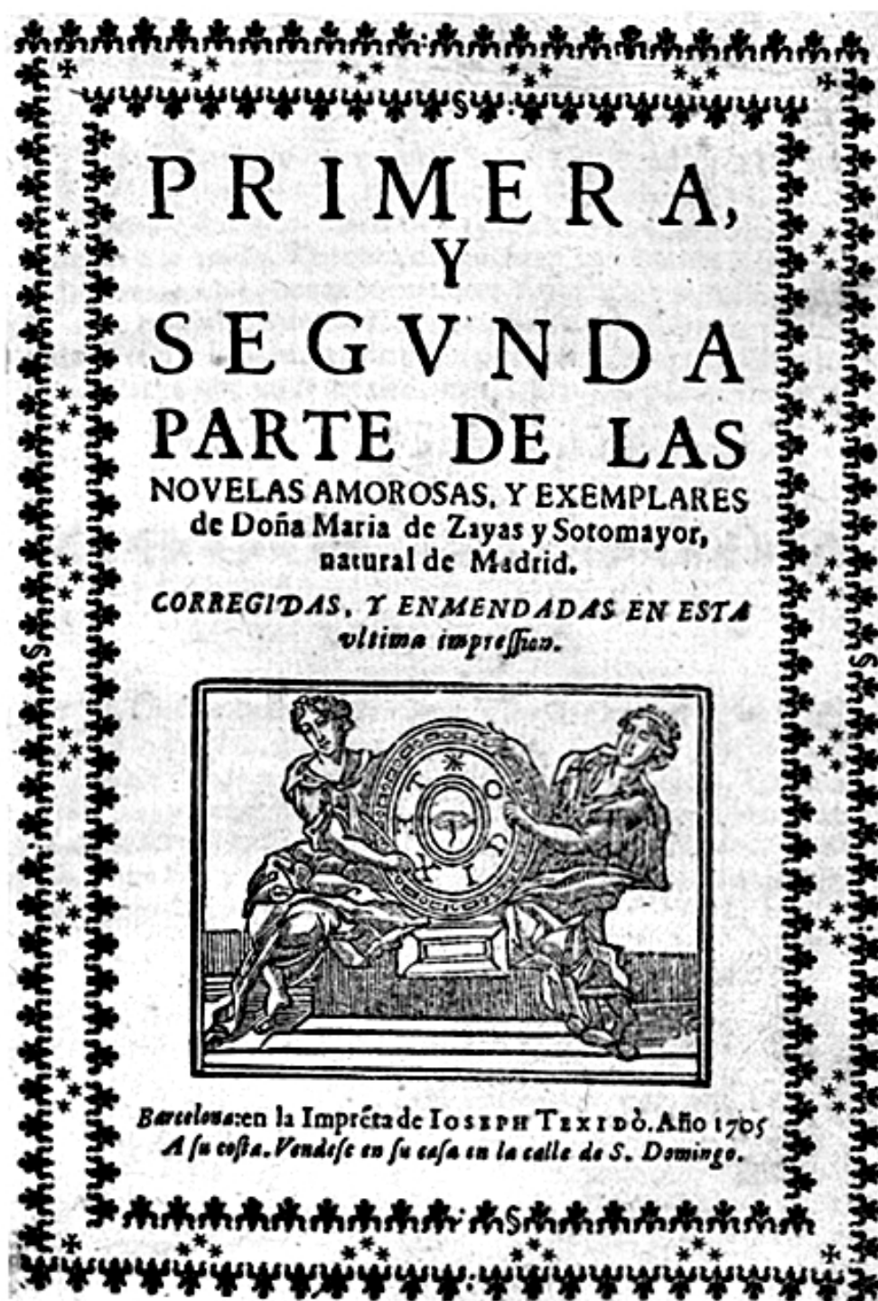
Portada de la edición de Barcelona, 1705